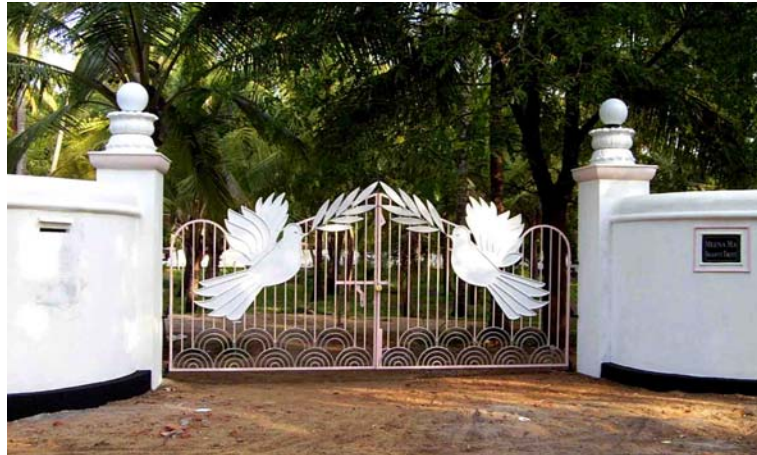
Eingangstor zum Kinderdorf in Thalikulam